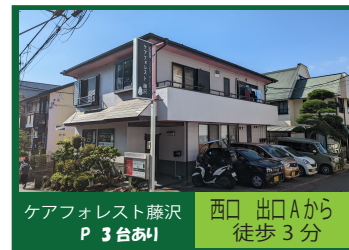
ケアフォレスト藤沢 P 3台あり 西口 出口Aから 徒歩3分